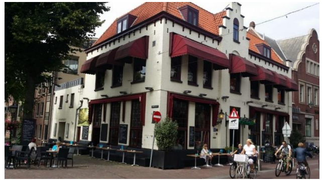
Hotel het Gulden Vlies, waarachter een toneelzaal was gevestigd. Op deze foto ontbreekt het beeld van Rudi Carrell.

We werden langs allerlei bijzondere panden gevoerd waarover onze gids veel wist te vertellen, niet alleen over de geschiedenis ervan maar ook over de bouwstijl waarin deze panden gebouwd zijn. Hij wist ons ook de betekenis van Heul en Laat duidelijk te maken. Ik laat hier enkele bijzondere huizen volgen die we gepasseerd zijn en waarbij we kort hebben stilgestaan.