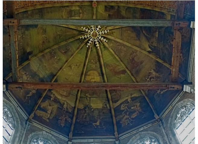
Cornelis van Oostsanen – het laatste oordeel.