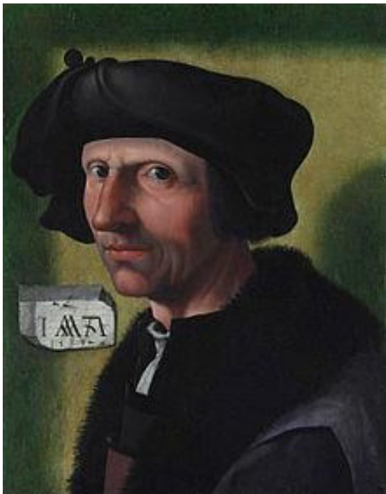
Zelfportret van Cornelis van Oostsanen.

daarom wil ik besluiten met iets te vertellen over de gewelfschilderingen die worden toegeschreven aan Jacob Cornelisz. van Oostsanen . Zeer waarschijnlijk heeft deze zijn broer Cornelis Buys ingeschakeld hebben bij dit enorme werk. Vooral in de houding van de figuren kan men zien dat de middeleeuwse traditie van schilderen gaat wijken voor die van de renaissance. In het midden van de schildering zien we een tronende Christus met aan weerszijden Maria en Johannes de Doper. Daaronder zijn de doden afgebeeld die uit hun graven opstaan en die links en rechts van Christus hun eindbestemming vinden.