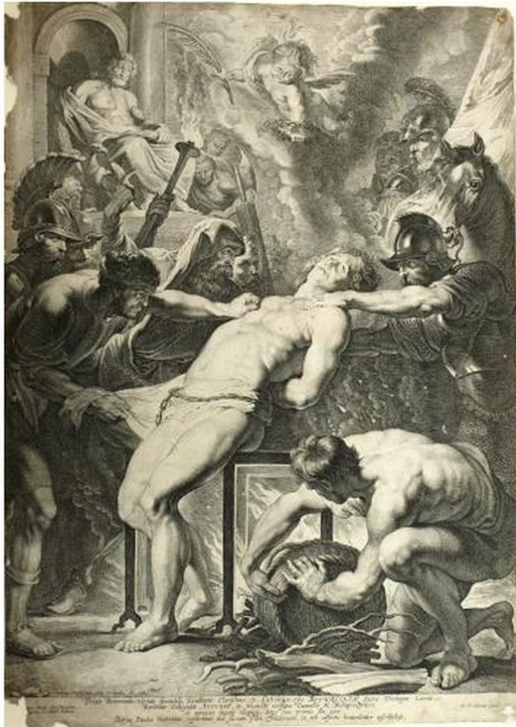
Gravure voorstellend de marteldood van Sint Laurentius.