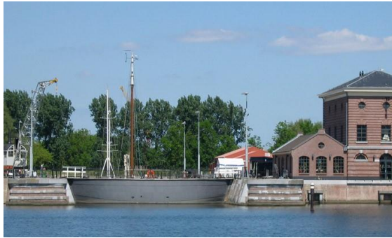
Droogdok Jan Blanken Hellevoetsluis.