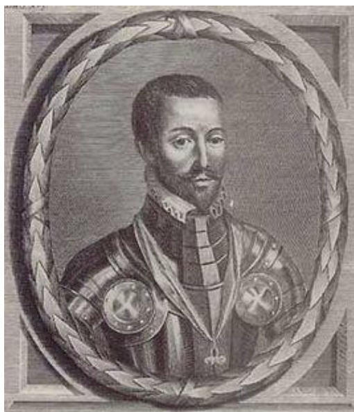
Hendrik van Brederode

Deelnemers van beide cursussen kunnen daarna zelfstandig onderzoek doen en artikelen schrijven eventueel in samenwerking met de redactie van het tijdschrift.