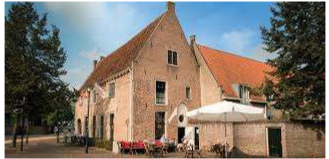
De Observant (voormalig klooster)