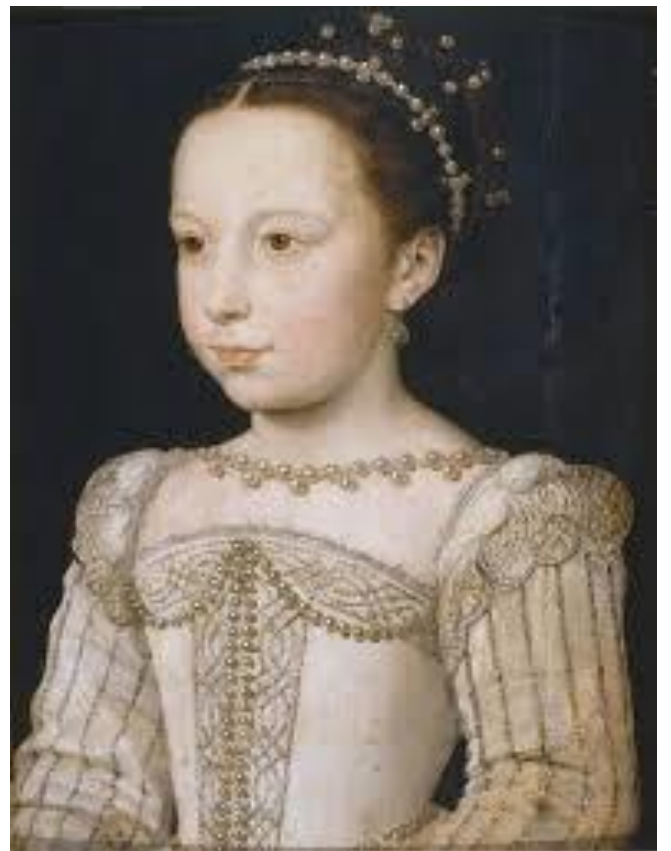
Margaretha van Valois – de echtgenote van Hendrik van Navarra.

Drijvende en sturende kracht achter de massa slachting was Catharina de Medici . Die was fel gekant tegen de groeiende macht van de Hugenoten binnen het Franse Koningshuis maar ook tegen het betrokken worden bij de strijd tegen het katholieke