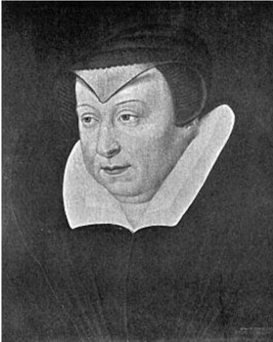
Koningin moeder Catharina de Medici.

Spanje en tegen de mogelijkheid dat de protestantse Hendrik koning van Frankrijk zou worden.