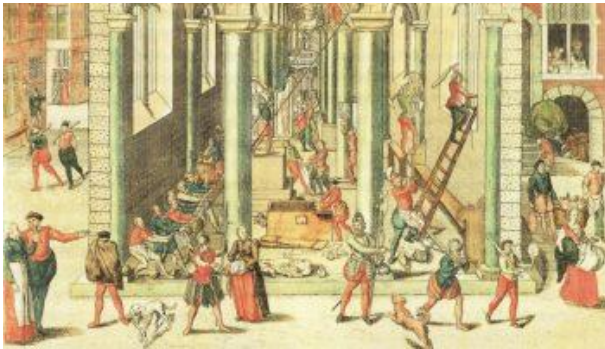
Begin van de Bartholomeusnacht vastgelegd door Francois Dubois.

Medici. Vooral de Koninginmoeder Catharina de Medici zag dit huwelijk niet zitten en nadat er eerst een aanslag was gepleegd op de leider van de Hugenoten Caspard de Coligny gaf Catharina het bevel om in de nacht van 23 op 24 augustus 1572 zoveel mogelijk Hugenoten te vermoorden.