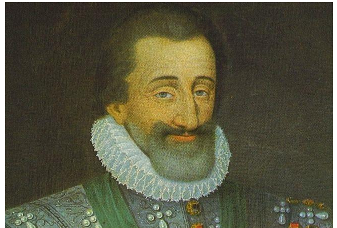
Hendrik van Navarra.