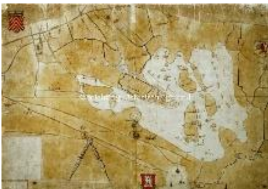
Oude prent met Egmondermeer.

Voor het droogmalen werd gebruik gemaakt van de uit de standerdmolen ontwikkelde Wipmolen . De totale oppervlakte van de doorgemalen meren bedroeg liefst ca. 800 hectare. Voor die tijd een geweldige prestatie.