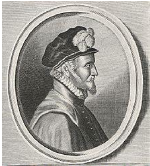
Fabrique Alvarez de Toledo.

nadat ze de sluizen bij Spaarndam hadden ingenomen sloegen de troepen o.l.v. Don Frederik het beleg en al op 21 december voerde hij een eerste bestorming uit, die op een fiasco uitliep. 150 Spaanse soldaten kwam om het leven. Binnen de muren van Haarlem was een legermacht van ca. 3000 soldaten o.l.v. Ripperda aanwezig.