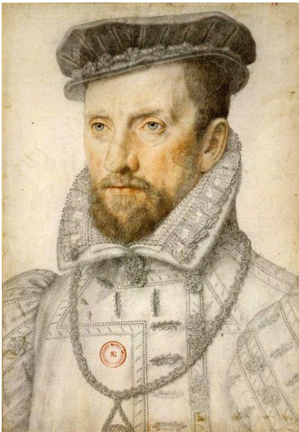
Gaspard de Coligny-leider van de Hugenoten.