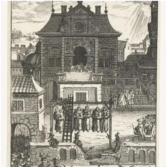
Een prent van de ophanging van de vijf Minderbroeders uit Alkmaar.

windmolens legt hij het Berger meer droog.