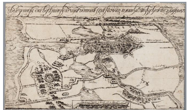
Prent met het beleg van Alkmaar.