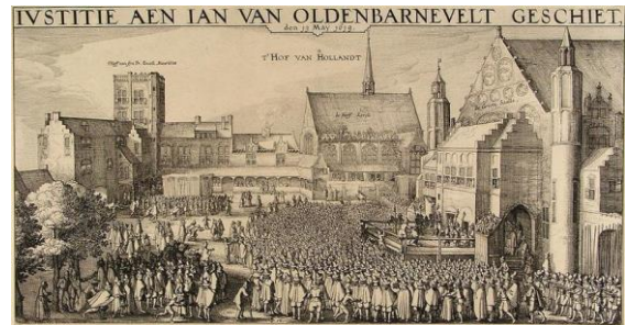
Het volgestroomde Binnenhof woont de terechtstelling van Van Oldenbarnevelt bij.