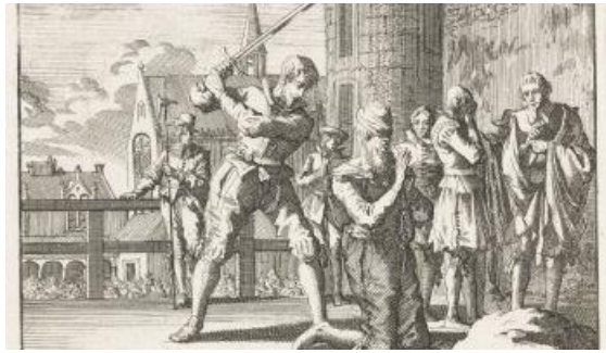
Onthoofding van Johan van Oldenbarnevelt door Jan Luyken