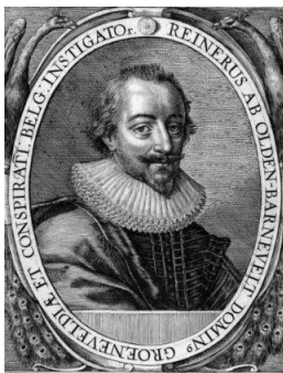
Deze zoon van Oldenbarnevelt belandde ook op het schavot.